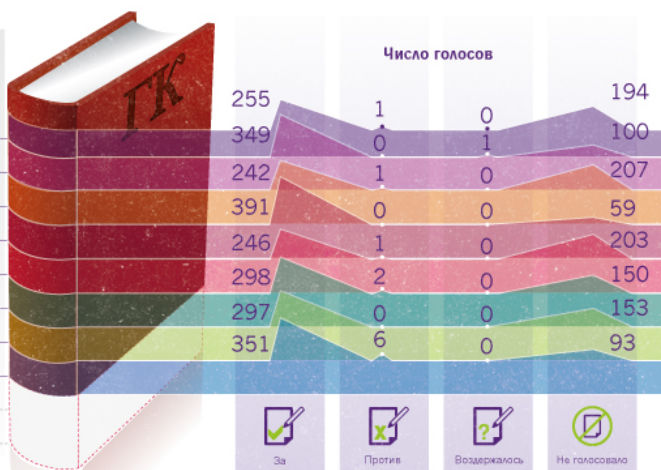
Результаты голосования по каждому блоку изменения ГК в третьем чтении